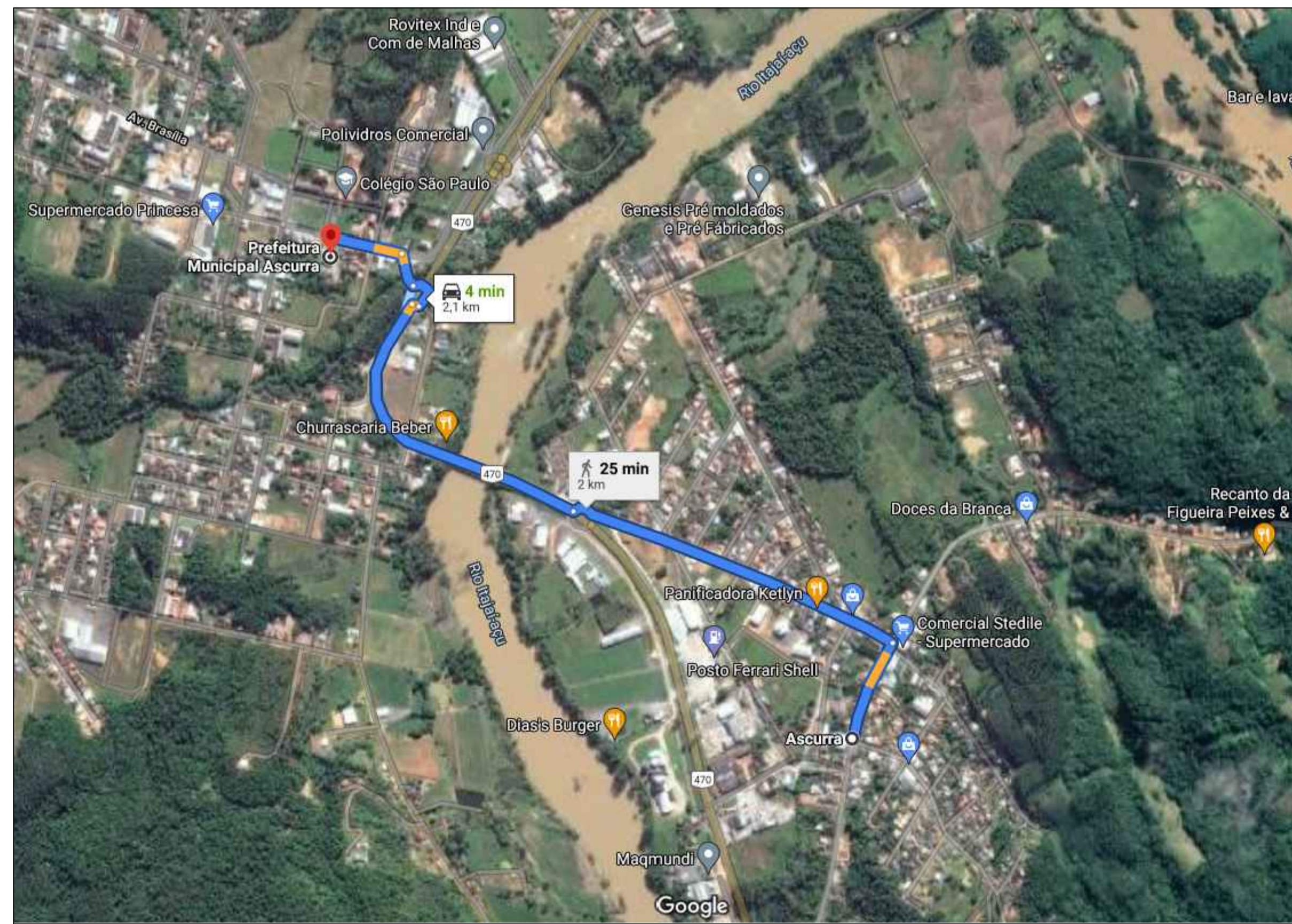
PLANTA DE LOCALIZAÇÃO ESCALA: SEM ESCALA