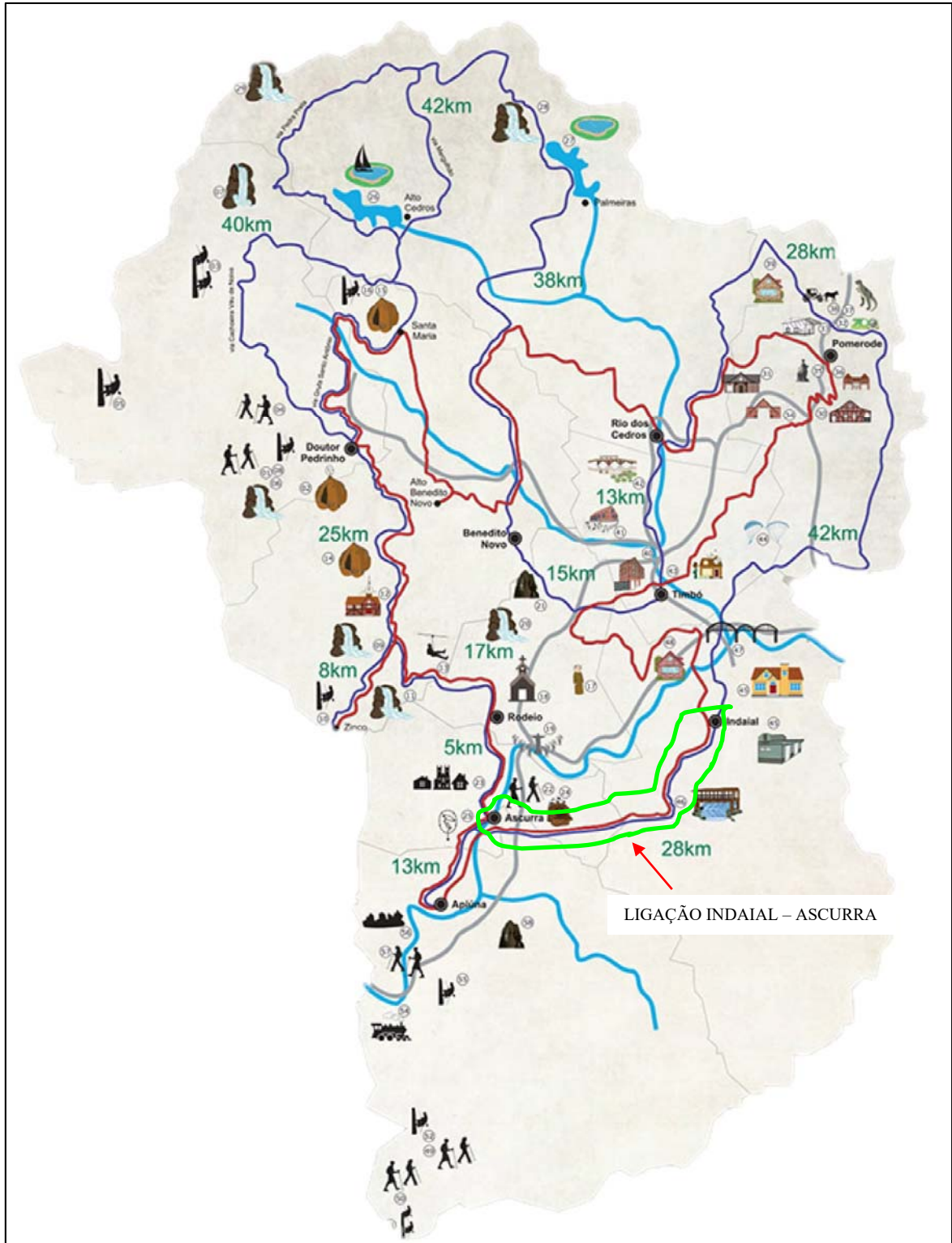
Figura 02 – Mapa do Circuito do Vale Europeu