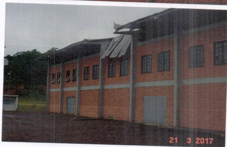
Torção, deslocamento das telhas e terças em concreto devido aos fortes ventos.